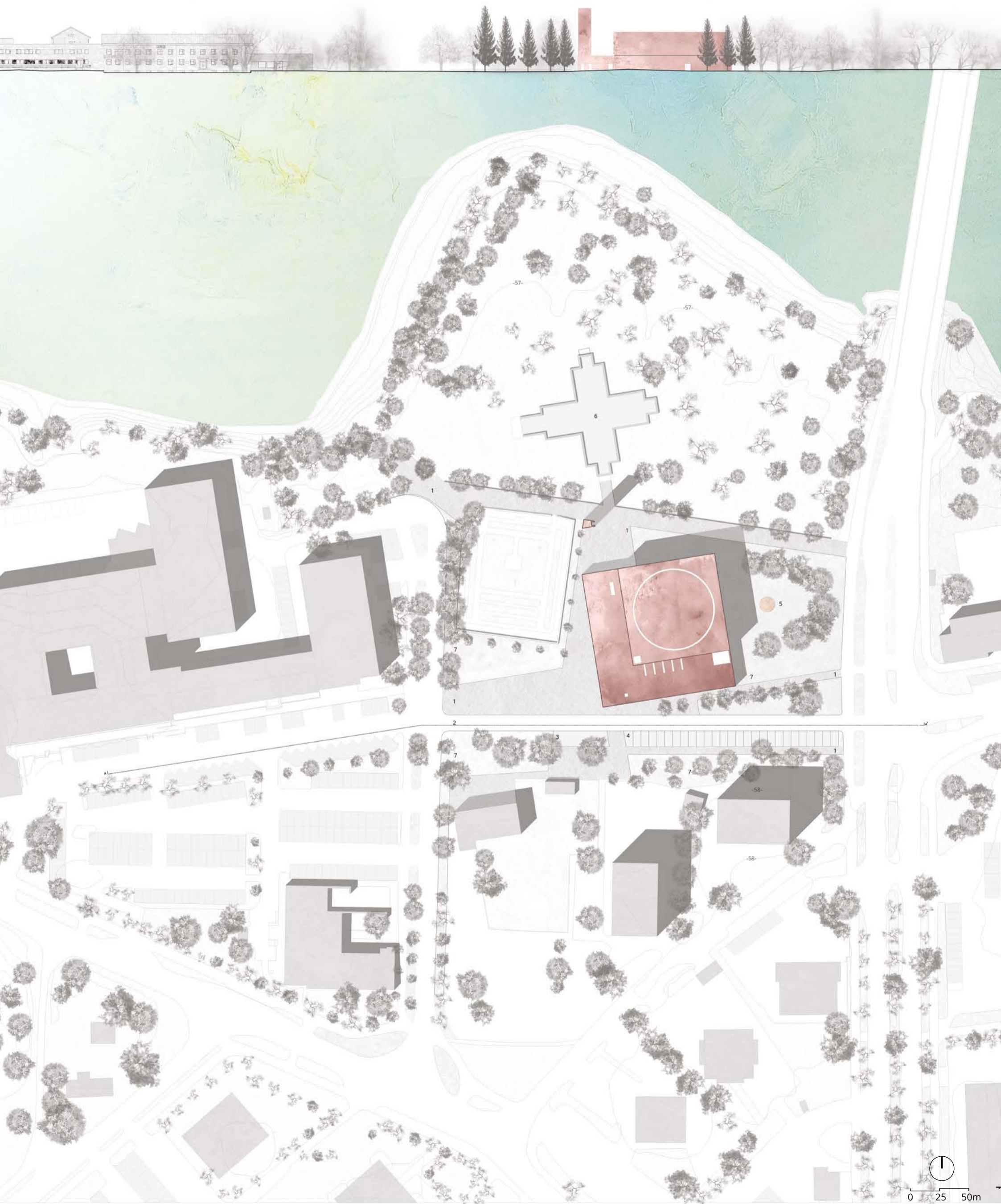
1. Kevyt liikenne 2. Ajoneuvoliikenne 3. Polkupyöräparkki 4. Pysäköintialue 5. Veistos (Lakeuden liekki) 6. Vanha kirkko 7. Viheralue